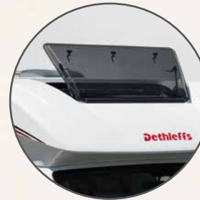
Groot, uitzetbaar raam in de kap boven de cabine