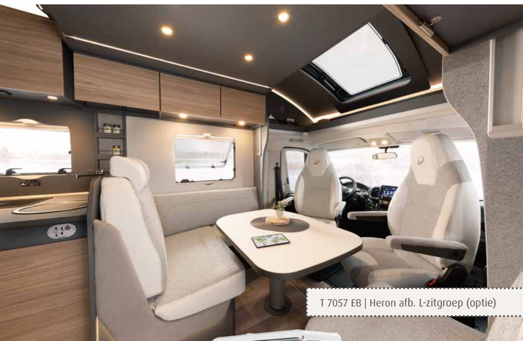
T 7057 EB | Heron afb. L-zitgroep (optie)