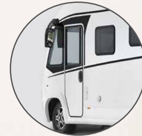
Bestuurdersdeur standaard bij integralen

Lifetime-Smart opbouwconstructie met houtvrije onderzijde voorzien van GFK-bekleding