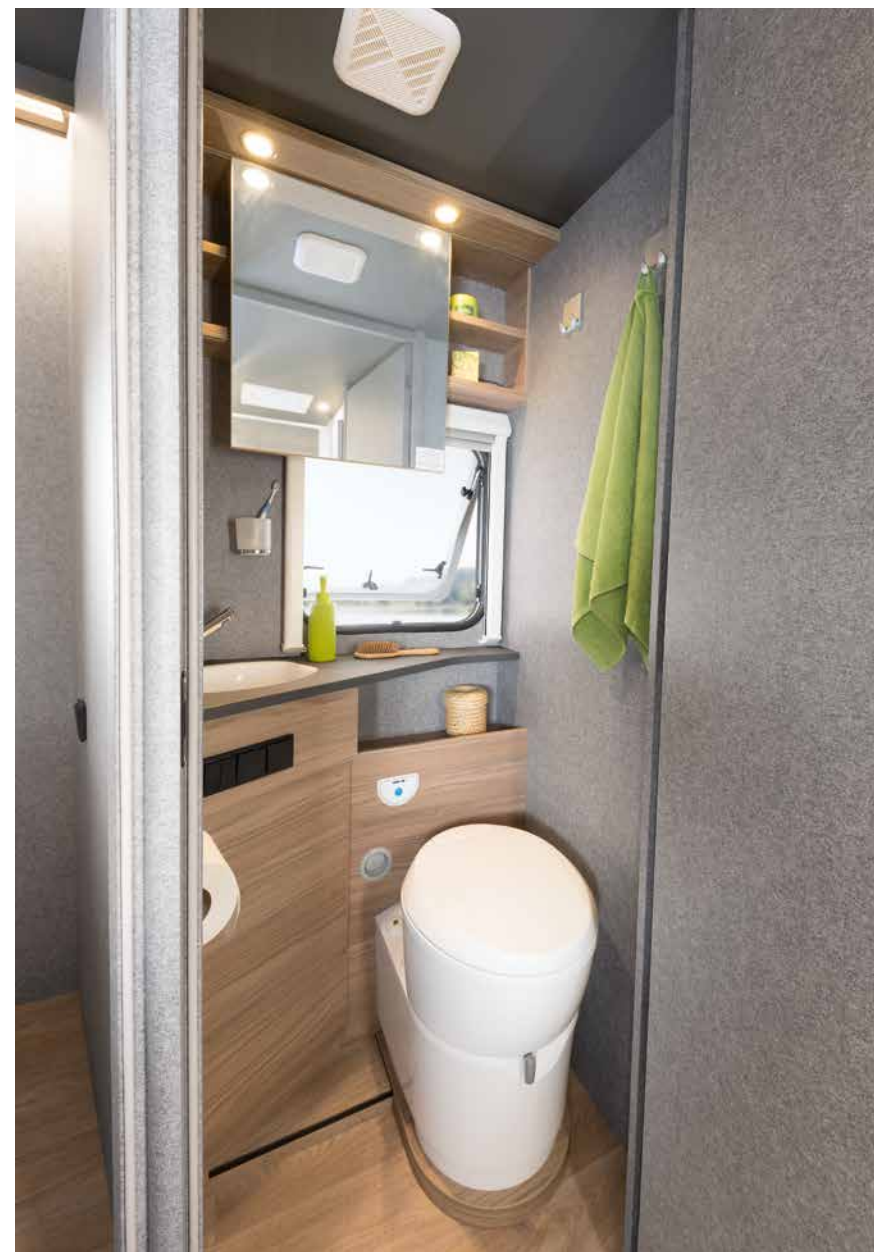
De spiegelkast met schuifdeur biedt veel opbergruimte. Relingen en elastische riemen beschermen de inhoud tegen uitvallen. Het openslaande raam (modelafhankelijk) zorgt voor een optimale ventilatie, vooral na het douchen. • T/I 7057 DBL