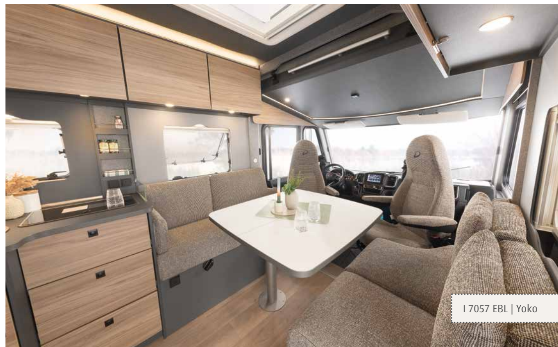
I 7057 EBL | Yoko

Beleef ook het grandioze ruimtegevoel tegen een vriendelijke prijs. De Trend integraal is uitgerust met alles wat deze serie van Dethleffs succesvol maakt en natuurlijk met de genen van een echte integraal: een fascinerende reiservaring dankzij de enorme panorama-voorruit, de ruimtelijke cabine en het standaard hefbed. Dit biedt uitstekend slaapcomfort en is met een afmeting van 196 x 150 cm ook nog wonderlijk groot.