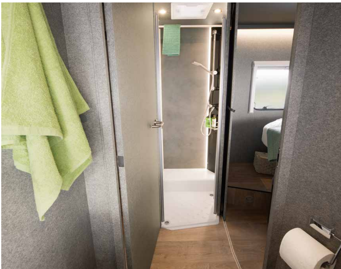
Een slimme oplossing: de ruime badkamer (modelafhankelijk). De badkamerdeur kan gebruikt worden om de doorgang naar de woonruimte af te sluiten. Zo ontstaat een grote was- en aankleedruimte met veel privacy. De badkamer kan van de slaapkamer worden gescheiden door een houten schuifdeur. • T/I 7057 DBL