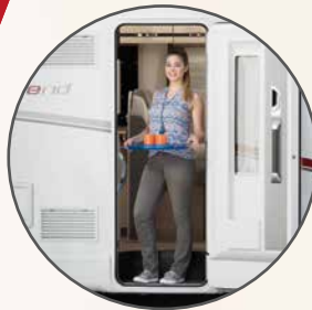
70 cm brede toegangsdeur met verlaagde instap