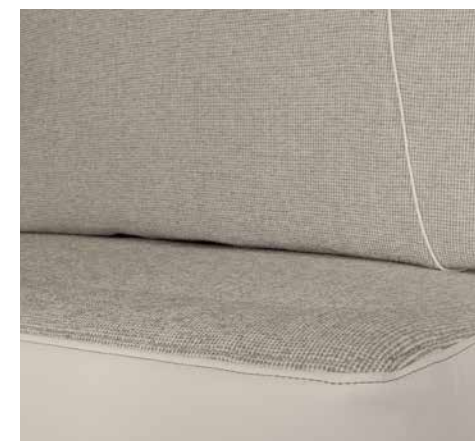
Heron - (met applicaties in lederlook)