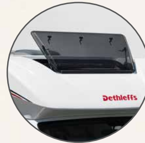
Grand lanterneau panoramique relevable dans la casquette de cabine