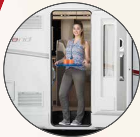
Large porte cellule de 70 cm pourvue d'un confortable marchepied intégré