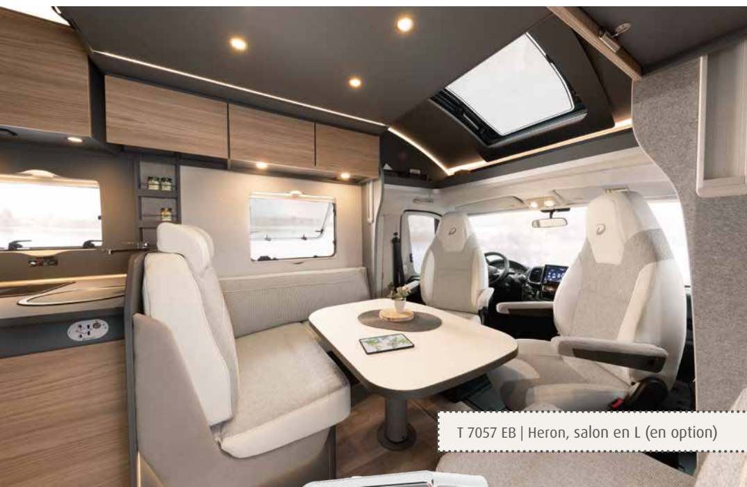
T 7057 EB | Heron, salon en L (en option)