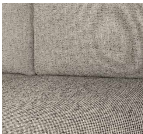
Saros (de série)