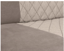
+ Wohnwelt Jupiter